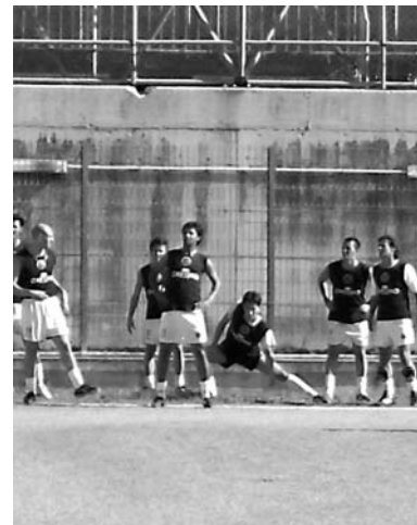
TUTTO OK. Un allenamento del Canosa